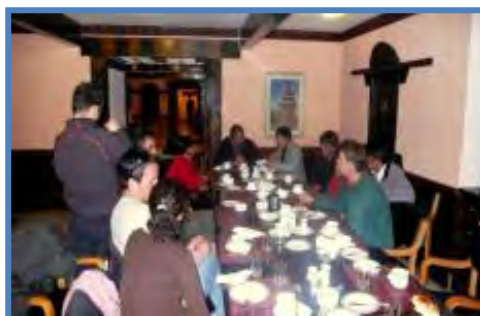
Réunion de travail avec les membres de la NCA et le président de l'EFC pour préparer le stage de formation en 2008

Nous avons eu la grande chance de trouver en les membres de la NCA des personnes particulièrement motivés et efficaces. Le travail de préparation et d'organisation effectué par la NCA lors du stage de formation et de la démonstration 2008 (programmation, invitations des officiels, transport, assurances, sponsors, communication...) a été d'une redoutable efficacité et l'association est à coup sûr un partenaire fiable et particulièrement dynamique. Elle a d'ailleurs déjà envoyé des délégués la représenter lors de rassemblement internationaux canyon, aux Etats-Unis (2006 et 2007) et en France (2008).