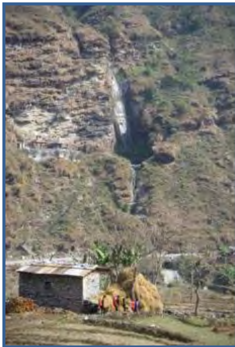
La C55 finale de Haadi Khola, Bhote Khosi