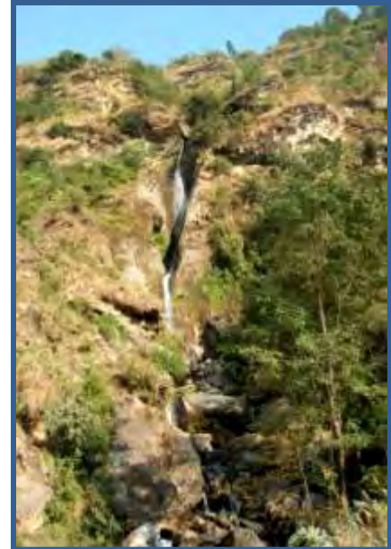
La C80 final de Fangfung Khola