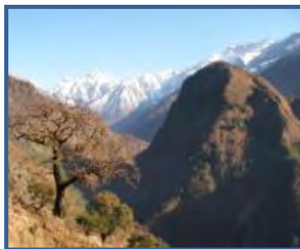
La vallée de la Marsyangdhi