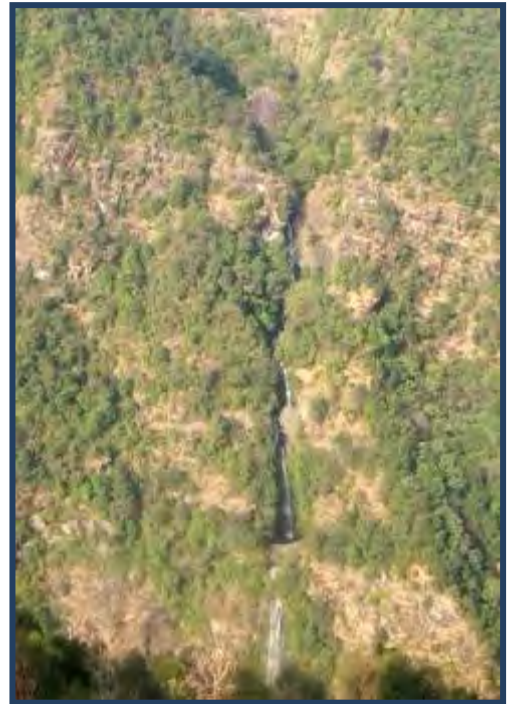
A ouvrir, dans la Melanchi Khola...