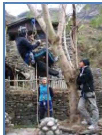
Exercices technique lors du stage de formation 2008