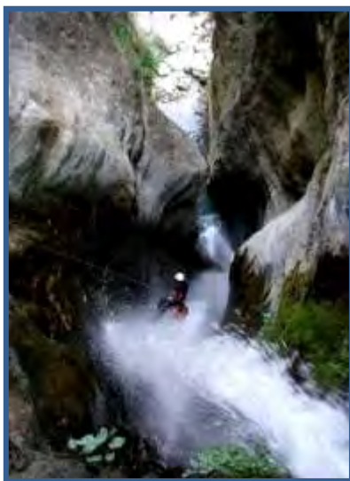
L'encaissement final de Kabre Khola, Bhote Khosi