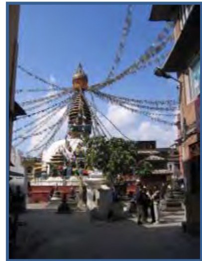
Temple bouddhiste à Katmandu

Majoritairement hindouiste (90%), le Népal est également le berceau du bouddhisme et les deux cultes coexistent parfois jusqu'à se confondre. Cette particularité confère au pays une richesse historique et culturelle de tout premier ordre. Les sites classés sont nombreux et les temples innombrables. Une forte atmosphère mystique et rituelle enveloppe le pays.