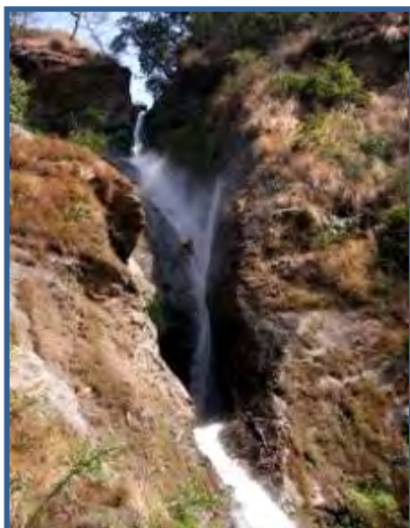
La C80 finale de Fangfung Khola