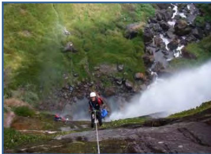
Kabindra dans la C130 du Syange Khola, vallée de la Marsyanghdi

Les canyons équipés offrent par ailleurs un éventail de difficulté très varié allant du facile (Jombo et Haadi Khola) à l'extrême (Chamje Khola), permettant ainsi une acclimatation progressive aux spécificités locales et faisant du Népal un spot d'entraînement et de perfectionnement idéal, d'intérêt sans aucun doute mondial. Une expérience conséquente, une bonne condition physique et une très bonne maîtrise des techniques d'équipement et de progression en verticales arrosées sont néanmoins recommandées pour pratiquer sur place.