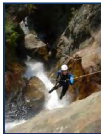
Le guidé final de Sansapu inf...